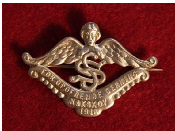
For opofrende Gerning - Æresgave Nakskov 1918

Erindringer og lokalhistorisk arkivmateriale - kilder, som særligt tages under behandling i foredraget - giver os navnlig et bedre indtryk af den spanske syges mentalitets- og social-historiske aspekter. Frem for alt efterladte beretninger fra almindelige familier giver et bevægende indtryk af den frygt og angst, der ramte befolkningen, og af det enorme hjælpearbejde, der blev iværksat på offentligt og privat initiativ under krisen.