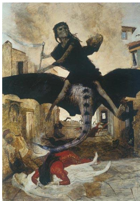
Arnold Böckling: Pesten (1898)