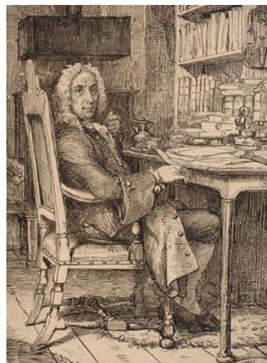
Wilh. Marstrand: Holberg i sin stue.

Foredraget er knyttet til Vejle Stadsarkivs aktuelle satireudstilling.