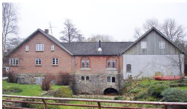
Haraldskærs Fabrikker

Efter oplægget er der plads til spørgsmål og diskussion. Giv gerne dine værdier og præferencer til kende vedrørende ådalens og fjordens fremtidige forvaltning.