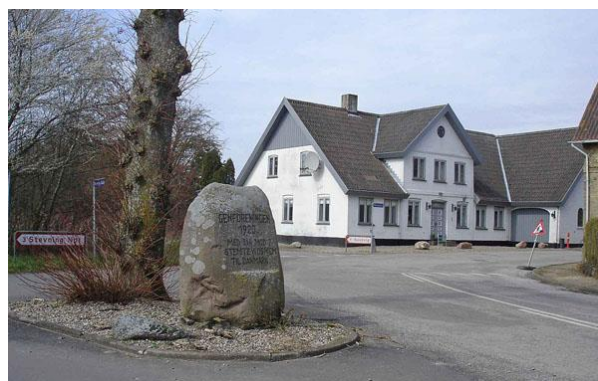
Genforeningssten i Stevning