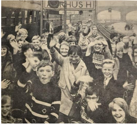
Børn fra Duborg-skolen på besøg i Aarhus 1961