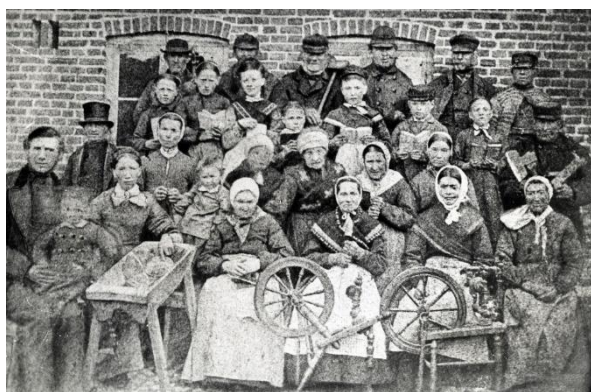
Fattige på fattiggården

Mange tror fejlagtigt, at der ikke findes arkivmateriale om fattige og gamle. Tværtimod - der er masser! Med fattigforordningen 1803 og forordningen om alderdomsforsorg 1891 som omdrejningspunkter kommer du på en spændende, men bestemt ikke altid lige munter rejse ind i den del af arkiverne, hvor du kan finde oplysninger om fattighjælp og alderdomsforsorg. Du skal med på fattiggården i Rønne for at se, hvad de gamle fik at spise, du skal med, når sogne lukker kassen i for en ansøgning om midlertidig hjælp - og meget mere.