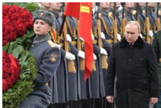
Putin ved den ukendte soldats grav