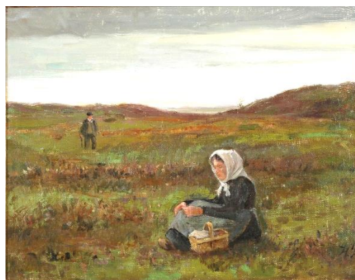
Hans Smidth: Studie til Tyttebærplukkersken