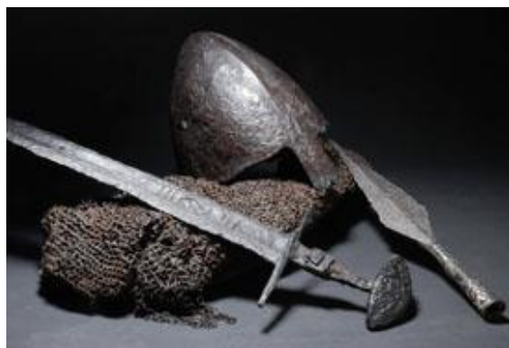
Vikingevåben fundet ved Lednica-søen, Polen