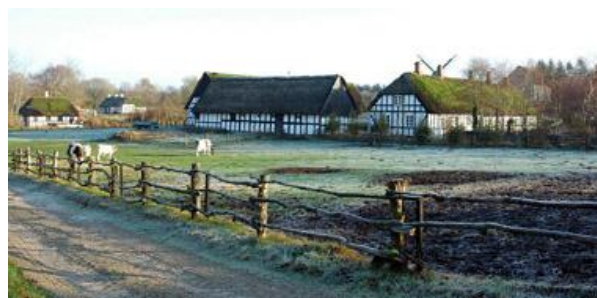
Hjerl Hede