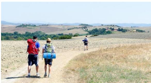
Moderne pilgrimme på vej mod Rom

Alt dette vil blive berørt i foredraget.